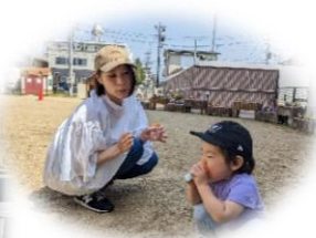
たくさん飛ばして楽しかったね♪