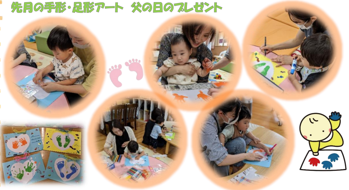
個性豊かでステキな父の日のプレゼントになりました♡♡♡