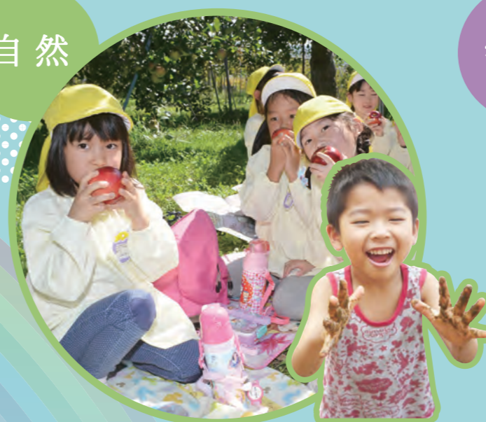
自然の中での体験や経験が子どもたちの好奇心や冒険心を養い、心身の発達にもつながっていきます。