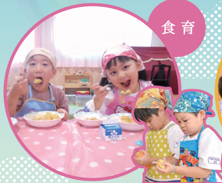
季節の旬の食材に興味を持ち、栽培やクッキングを通して、「食べるの大好き♡」な子ども達を育てています。