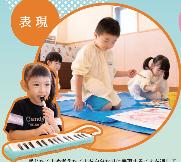
感じたことや考えたことを自分なりに表現することを通して豊かな感性や表現する力を養い、創造性を豊かにします。