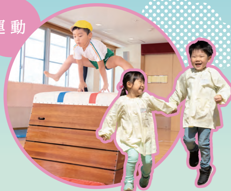
十分に体を動かす気持ち良さを体験し、自ら体を動かそうとする意欲を育てています。