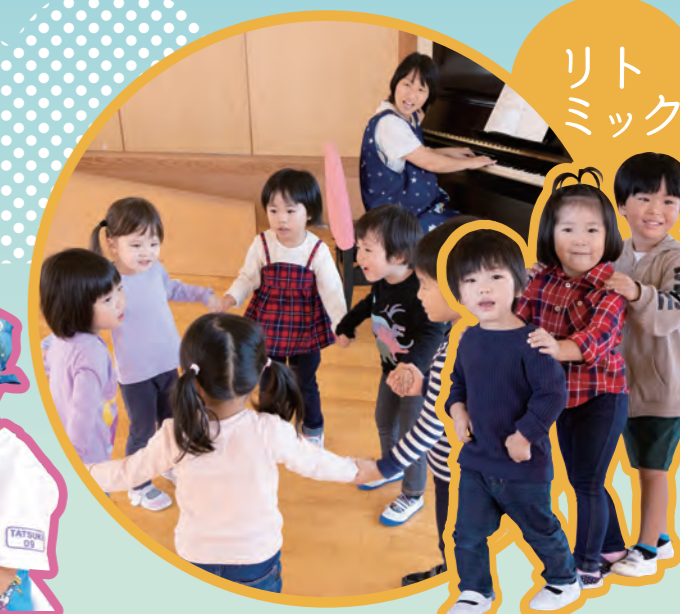
音楽を聞く・演奏するだけでなく、全身を動かしながら楽しく音楽に触れることで、子ども達の「感じる心」を豊かにしています。