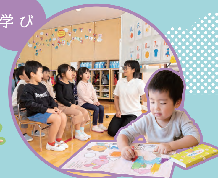
遊びは子ども達にたくさんの学びを与えてくれます。遊びを通して想像力やコミュニケーション能力など様々な力を獲得していきます。